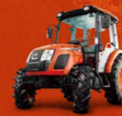
SERIES RX (73 PK)