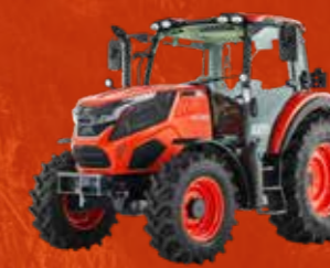
SERIES HX (90-140 PK)