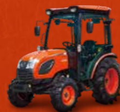
SERIES CK30 (26-50 PK)