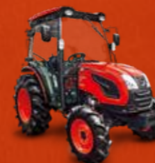
SERIES DK20 (45-60 PK)