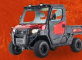
K9 (24 PK)