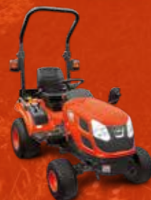
SERIES CS (21-25 PK)