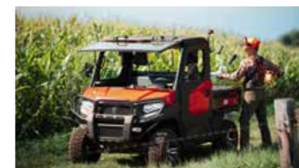
2023 Komst van de UTV cabine met airco