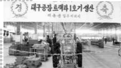
1968 Eerste tractor geproduceerd in Korea