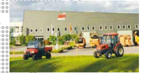
2010 Oprichting van Kioti EU in Nederland