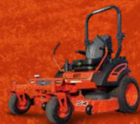
SERIES ZX (24-25 PK)