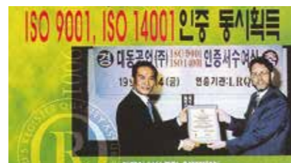
1996 Certificering volgens ISO 9001 en ISO 14001