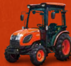
SERIES CK30 (26-50 PK)