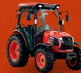
SERIES DK30 (45-60 PK)