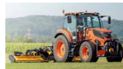
2022 Introductie HX Serie