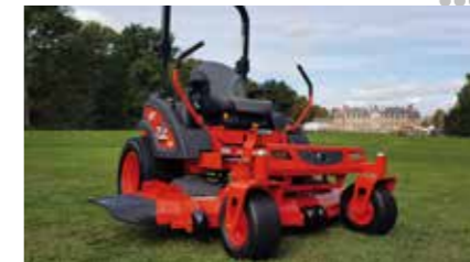
2020 Lancering ZERO TURN maaier