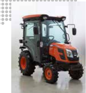
2021 Introductie STAGE 5 tractors