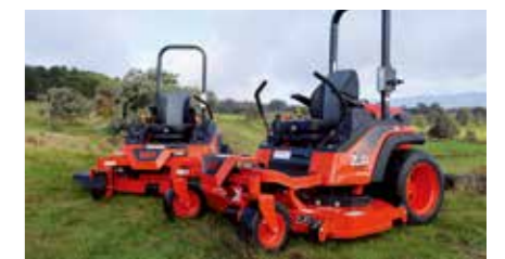
2024 Introductie van de ZERO TURN DIESEL maaiers