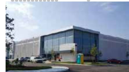
2018 Oprichting van Daedong Canada Inc. (Canada)