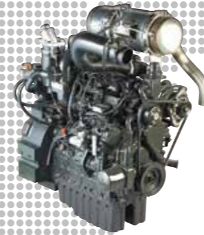
2013 Eerste Stage IIIB motor geproduceerd (common-rail)