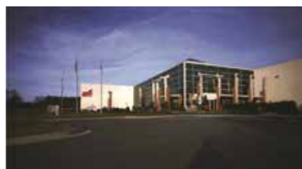
1993 Oprichting van Daedong USA