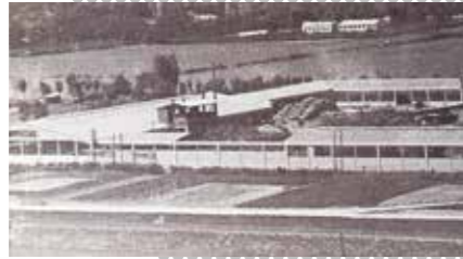
1947 Oprichting van DAEDONG Industrial in Jinju-si, Gyeongsangnam-do