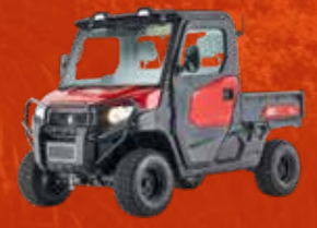
K9 (24 PK)