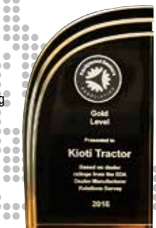
2016 Voor de derde keer op rij Winnaar van de 'Gold Level Status Award' van de Amerikaanse dealers Association (EDA)