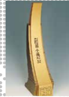
2008 Award voor Export ten bijdrage van 100 miljoen USD