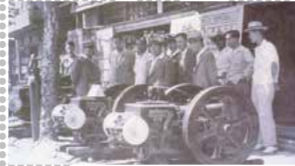
1956 Bouw van motoren en diesel motoren