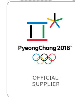
2015 Officiële partner van Olympische Winterspelen 2018 in Pyeongchang