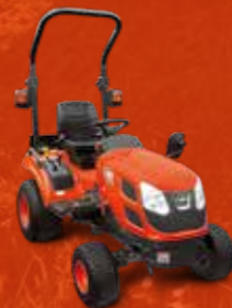
SERIES CS (21-25 PK)