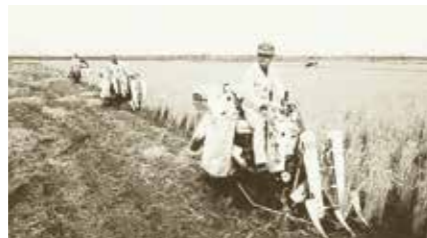
1970 Eerste maaidorser gemaakt in Korea