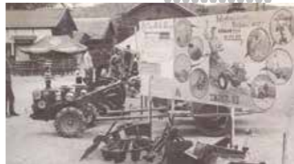
1962 Productie van de eerste Koreaanse frezen