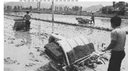
1973 Eerste rijstplant machine geproduceerd in Korea