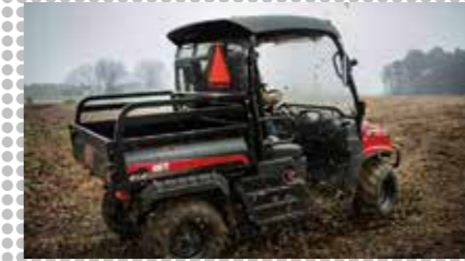
2009 Eerste Mechron 2200 UTV