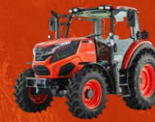
SERIES HX (90-140 PK)