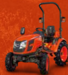
SERIES CX10 (25 PK)