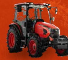
SERIES RX (73 PK)